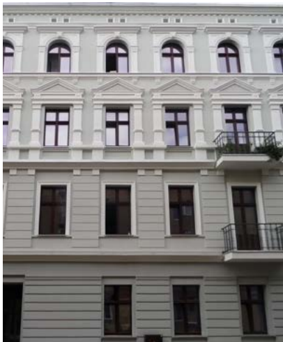
Łódź, ul. Próchnika, wyk. SMART BUD M. Matusiak

Styropian kojarzy się przede wszystkim z docieplaniem budynków. Stosuje się tu styropian miękkki, który jest powlekany klejem z siatką i docelowo zacierany tynkiem dekoracyjnym. I wiele termomodernizacji na tym etapie się kończy. Minimalizm stosowany w nowatorskich projektach często pomija upiększanie elewacji gzymsami i listwami ze styropianu.